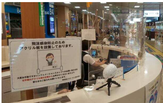
アクリルパネルの設置(インフォメーション)