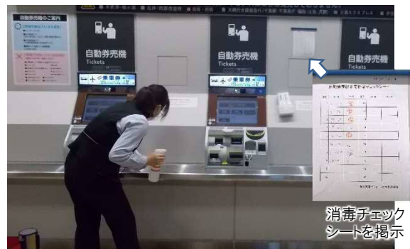
自動発券機の消毒