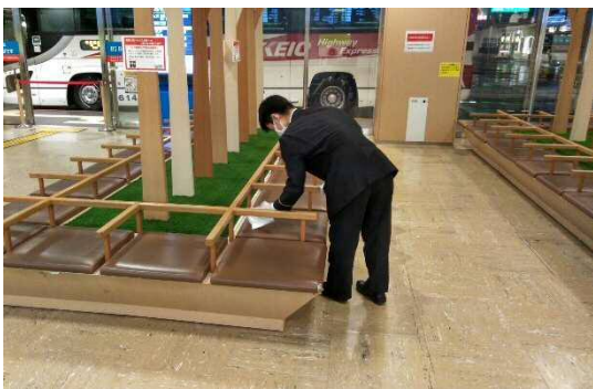
待合室ベンチの消毒